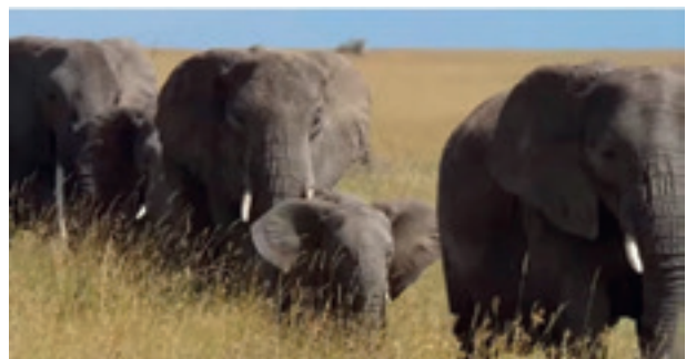
Beeld uit de documentaire There is a place on earth

Toegang: € 7,50, ga voor tickets naar de website van het Dominicanenklooster Zwolle.