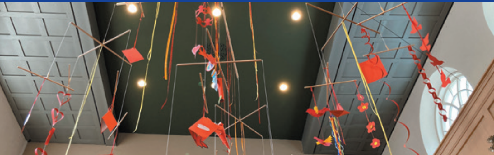
“Een grote rode mobiel, bewegend op de wind, als op de Adem van God”