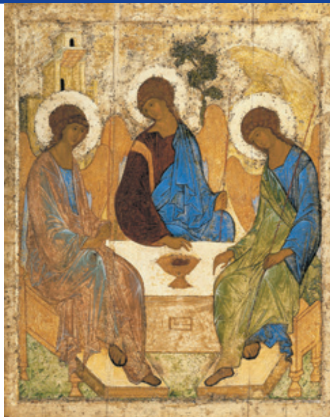
de Heilige Drievuldigheid

Hoe de Drie-eenheid onderling met elkaar omgaat is een voorbeeld voor ons hoe wij met elkaar om moeten gaan: zij zijn beleefd, vriendelijk, er is liefde, de een acht de