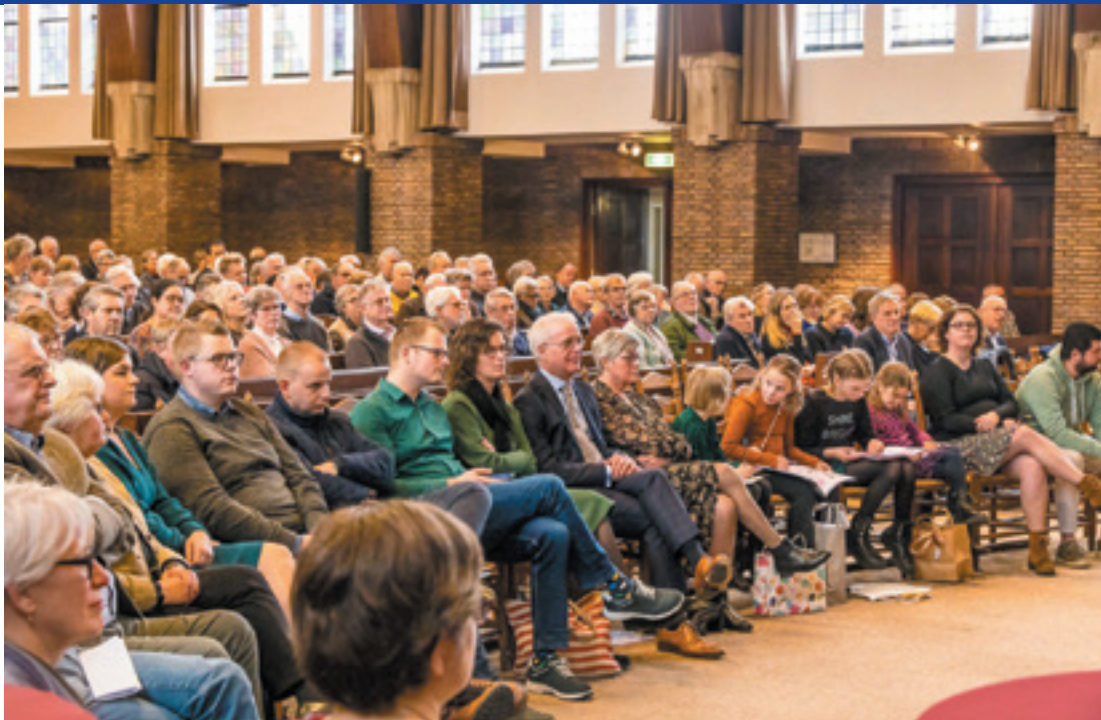
In een goed gevulde Jeruzalemkerk vond op 3 februari 2023 het Symposium 'Diaconie, hart van kerk en stad' plaats