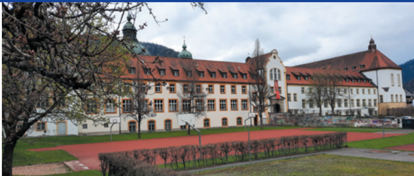
De abdij van Ettal