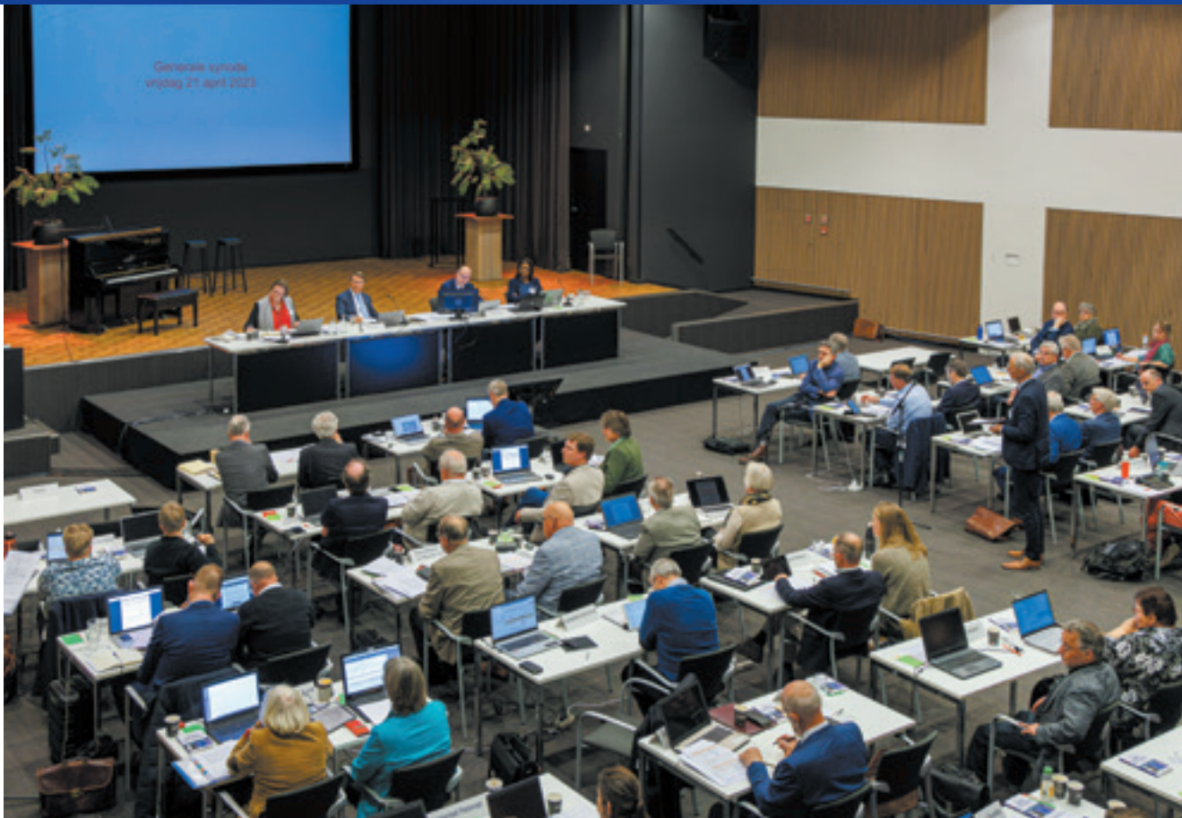
Bijeenkomst van de generale synode op vrijdag 21 april 2023