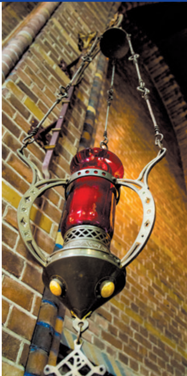
'Vlam die niet dooft', Godslamp in de Dominicanenkerk aan de Assendorperstraat