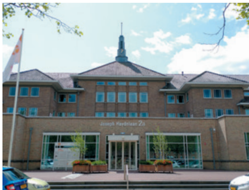
Dienstencentrum in Utrecht

Tot slot zijn er de Classicale Colleges en het Generale College voor de behandeling van Bezwaren en Geschillen (CCBG's en GCBG). Wie het niet eens is met een besluit