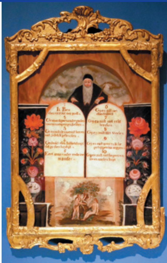
Tiengebodenbord, Museum Catharijneconvent

Wel, Gods geboden zijn een richtsnoer in onze omgang met Hem. Hij ziet er naar uit dat we zijn weg gaan. Maar: past daar dit gebed bij? Zou er een moment kunnen