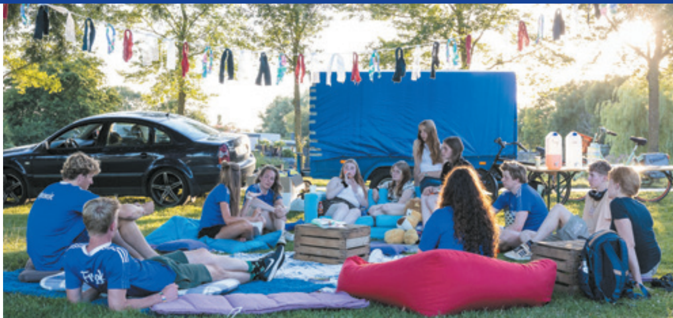
Sportweek in Westenholtte (2022)