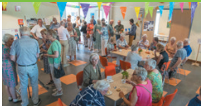
Impressie van de ontmoeting na de dienst

Na de viering was er gelegenheid om met elkaar in gesprek te gaan en herinneringen te delen. In de kerkzaal waren foto's te zien