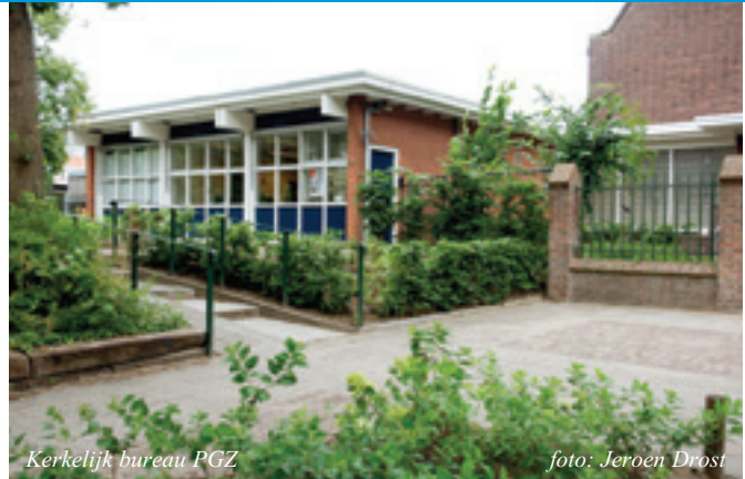
Kerkelijk bureau PGZ

U kunt voor de collecte ook digitaal betalen via een van de collecte-apps, kijk voor meer informatie op www.pknz zwolle.nl , onder 'bijdragen'