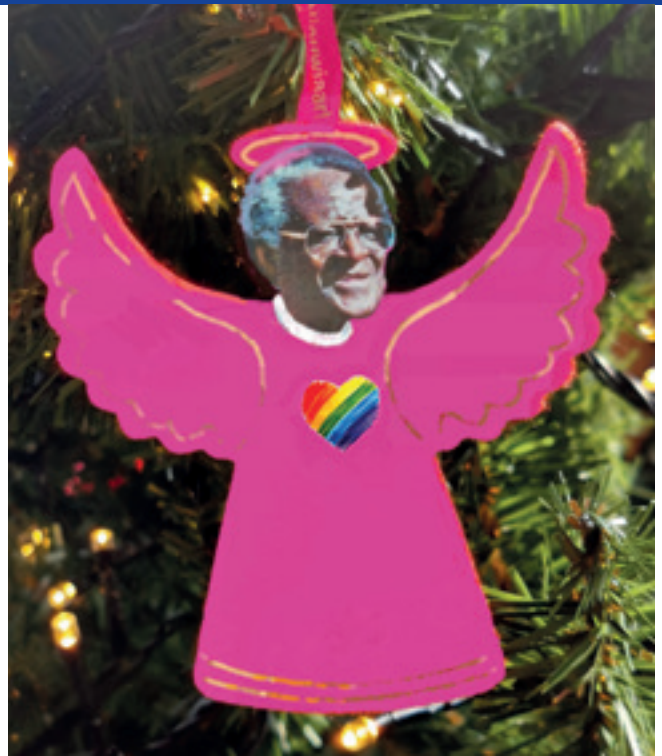
Toelichting bij deze illustratie: zie pagina 17

De zes begeleidende zondagen op weg naar Pasen hebben een eigen naam. De namen verraden nood: Invocabit ('... roept de mens, Ik zal hem antwoorden'), Reminiscere ('... vergeet uw barmhartigheid niet!'), Oculi ('... houd je oog gericht op de Heer!'), maar dan volgt er een vreugdevolle naam: 'Laetare', zondag verheugt u! Verheugt u met