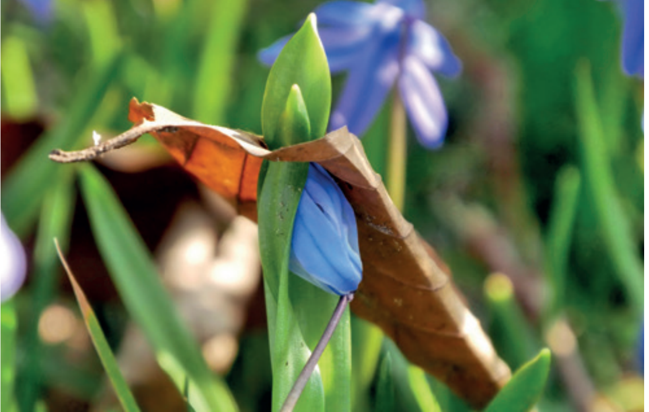
Tineke Vlaming: Boshyacynth omwikkeld door dood blad