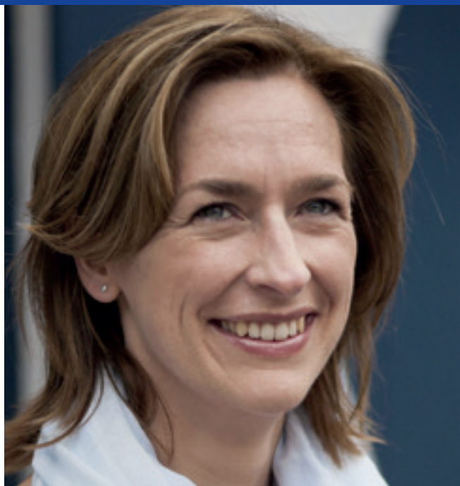
Christien deed met Pinksteren 2019 belijdenis in de Open Kring

een persoonlijke keuze is! Het dwingt je tot nadenken.” Een ander is verrast door de inhoud. Ook hij noemt de diepgang en voegt daar uitdaging aan toe, “... waardoor je er thuis mee verder gaat”. Het boekje neigt tot een rationele benadering, maar gaat weldegelijk ook de diepte in.