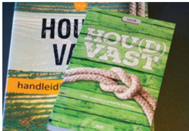
Hou(d)vast (om vandaag je geloof te belijden)

doorgaans niet om woorden verlegen zit. Woorden dekken voor mij de lading niet. Ze zijn me te groot of juist te plat. Het is ook intiem. Ik ervoer een diep verlangen. Ik wil geloven. Het vertrouwen ervaren dat God mij omsluit. Dit vertrouwen is er op momenten. Op zo’n moment gaat het niet om prestatie of status, maar ervaar ik dat ik ben waar ik moet zijn en voel ik mij verbonden. Verbondenheid is voor mij belangrijk. Daar zit ook een stuk van mijn angst en mijn verlegenheid in het verwoorden van mijn geloof. Want woorden kunnen verbinden, maar ook verwijderen. Als ze te stevig zijn, duw ik dan mijn niet-religieuze vrienden niet van me af? Als ze niet stevig genoeg zijn, beken ik dan wel voldoende kleur? Zo bekeken is het eigenlijk ook wel een veilige weg geweest om mij wat zoekend op te stellen. In mijn zoeken is het me duidelijk geworden dat geloven te maken heeft met kiezen. Ik wilde de keuze maken belijdenis te doen, mij verbinden aan de traditie, me uitspreken. Hoe mooi is het dan om in mijn zoektocht woorden aangereikt te krijgen? De woorden van de traditie. Bijzonder om te ervaren dat deze woorden mijn woorden niet zijn en ik ze toch volmondig wilde beamen. Omdat het voor mij woorden van verbinding zijn.”