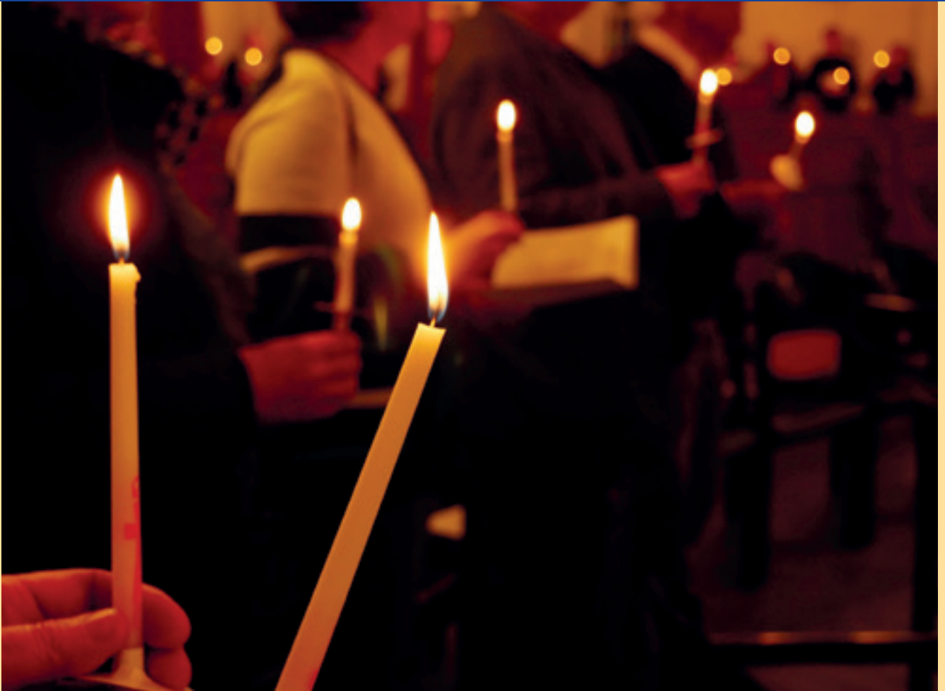
'Als alles duister is', Paaswake 2018, Oosterkerk