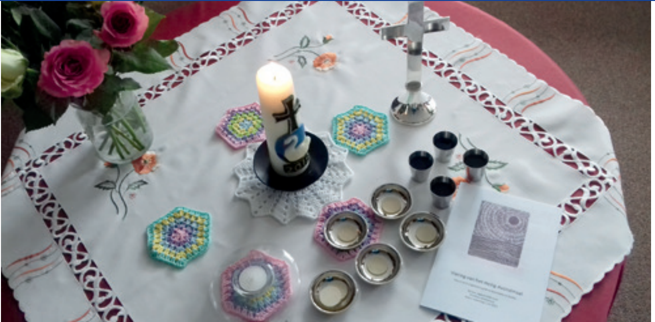
Lutherse avondmaalsviering in Assen, bij mw. Kiffers thuis; in coronatijd: met schaaltes en kleine kelkjes.