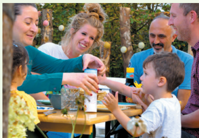
Een Zwols gezin geeft een warm welkom aan een Turks gezin

De meeste leerlingen uit Oekraïne zijn in Nederland opgevangen in kleinere dorpen uit de omgeving. Zij voelen zich bij ons thuis op een grote school met een internationale context – wij hebben meer leerlingen uit het buitenland – en vinden het prettig om in de stad te zijn. Vaak komen ze zelf ook uit grotere steden. Over het algemeen kunnen ze heel behoorlijk Engels en is het voor hen makkelijk om met hun klasgenoten en met ons te communiceren. Hoe het afloopt weten we niet, maar voorlopig lopen we een eindje samen met hen mee.