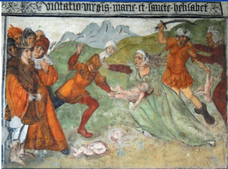
De kindermoord, fresco in Santa Maria Assunta (Elva, Italië)